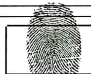
Huella Índice Derecho